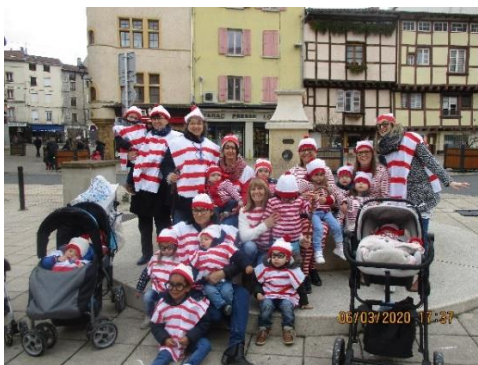
Participation au CARNAVAL 2020 de la ville de Tarare