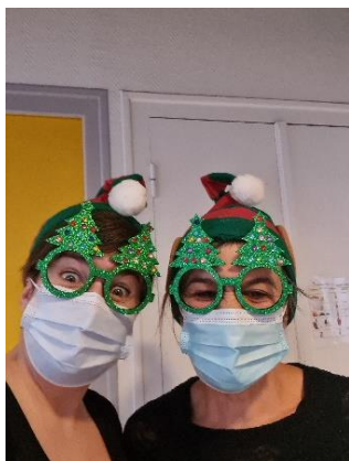
Les lutins et leur théâtre d'ombre chinoise

Pour finir ce temps collectif, un petit goûter façon « pique-nique » était proposé aux enfants. Un panier rempli de papillotes, brioche et jus de fruits à fait son apparition et les enfants ont su les apprécier !! Au milieu de ce panier, l'équipe avait préparé un petit cadeau pour chaque assistante maternelle à partager avec les enfants qu'elles accueillent : l'histoire du spectacle, quelques chansons et jeux de doigts agrémentés de petites recettes de cuisine. Un joli moment, festif en cette fin d'année si particulière !